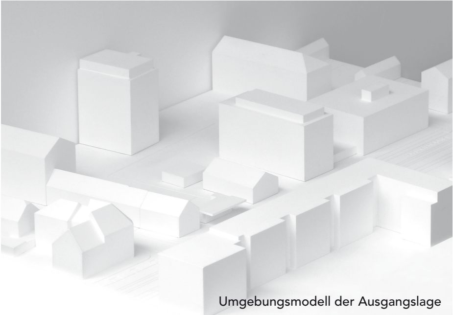
Umgebungsmodell der Ausgangslage