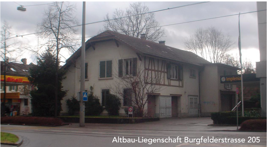
Altbau-Liegenschaft Burgfelderstrasse 205