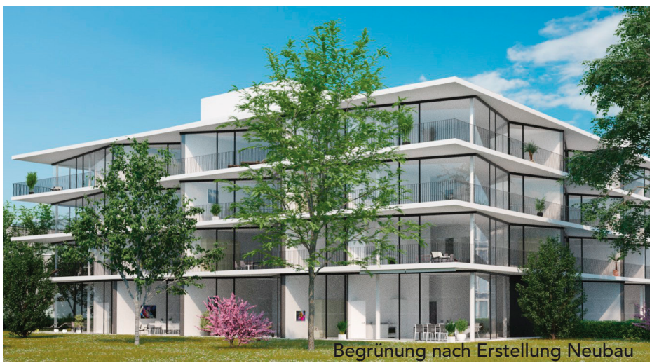
Begrünung nach Erstellung Neubau