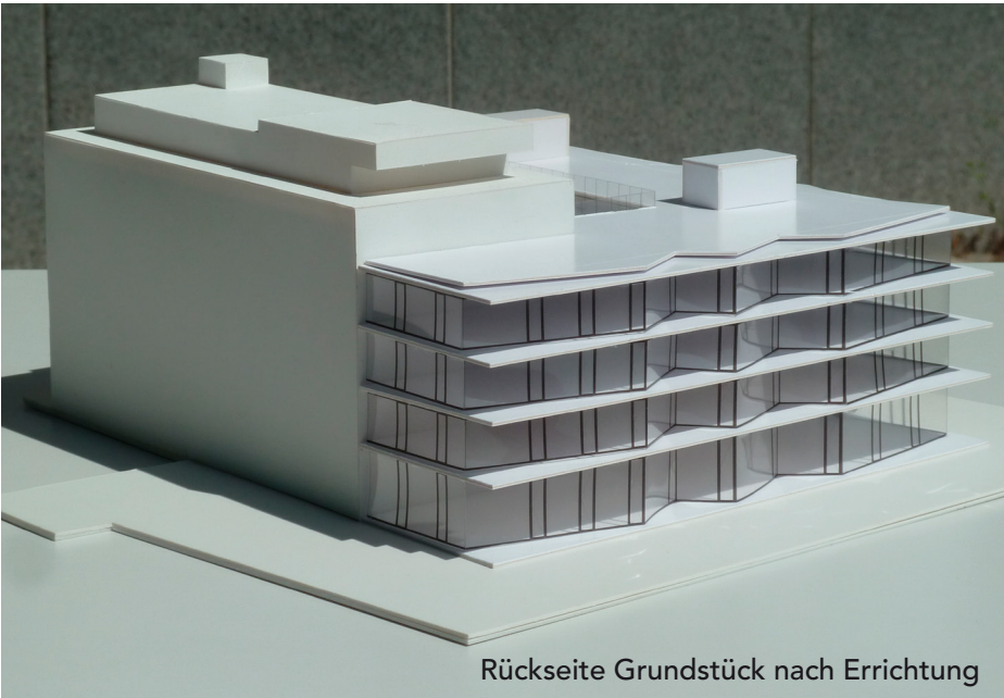
Rückseite Grundstück nach Errichtung