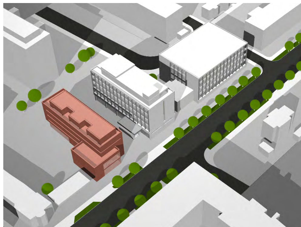
Perspektive Strasse Ost

Parzelle 3 Grundstücksfläche hi. Baulinie: 1179 m 2 Bebaute Fläche: 864 m 2 Freifläche: 315 m 2 (50% Regelung entfällt)