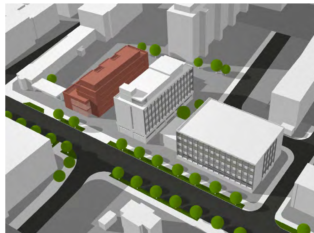
Perspektive Strasse Nord